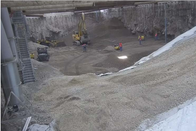
Aus sauberem Schotter wird eine neue Rampe erstellt; Quelle: Pressefoto Roche

Nach Abschluss der Umsetzung der Abluftreinigungsanlage und weiterer Elemente der technischen Installationen vom Baufeld Süd in das sanierte Baufeld Nord, kann voraussichtlich im November 2018 mit den Aushubarbeiten im Baufeld Süd begonnen werden. Als dritter und letzter Bauabschnitt folgt dann das Baufeld Mitte nach der Umsetzung der Schleusen mitsamt der Logistikfläche. Die Sanierungsarbeiten dauern voraussichtlich bis 2020.