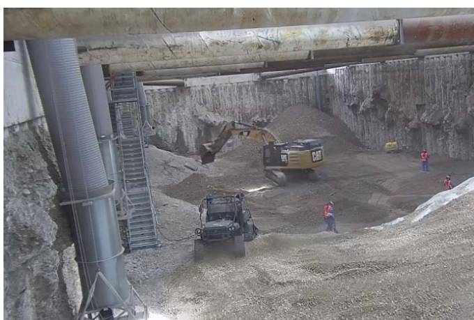
Blick in das Halleninnere: Das Baufeld Nord ist vollständig ausgehoben; Quelle: Pressefoto Roche.

Das erste der drei Baufelder, das Baufeld Nord, ist vollständig ausgehoben. Mit der in der vergangenen Woche ausgebauten Rampe wurde das letzte verbliebende belastete Erdreich entfernt. Die bisher erfolgte Wiederverfüllung hatte zum Zweck, aus sauberem Schotter eine neue Rampe zu erstellen sowie eine Deckschicht einzubringen. Damit wurde eine saubere Arbeitsfläche für die weiteren anstehenden Arbeiten geschaffen. Derzeit erfolgt die vollständige Reinigung der Hallenkonstruktion und der Innenwände im Baufeld Nord durch zwei Spezialfirmen aus der Region (Grenzach-Wyhlen und Waldshut-Tiengen). Erst nach der vollständigen Reinigung - voraussichtlich Mitte Juli - wird die Wiederverfüllung mit sauberem Erdreich fortgesetzt und bis ca. Ende August 2018 abgeschlossen.