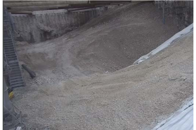
Die neu erstellte Rampe ist fertiggestellt; Quelle: Pressefoto Roche.