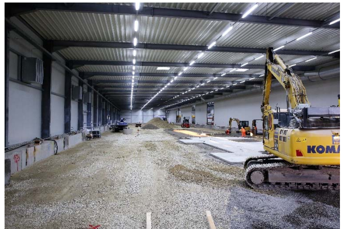
Im Anschluss an die Wiederverfüllung haben im Baufeld Nord die Arbeiten für die Verlegung der Betonplatten begonnen