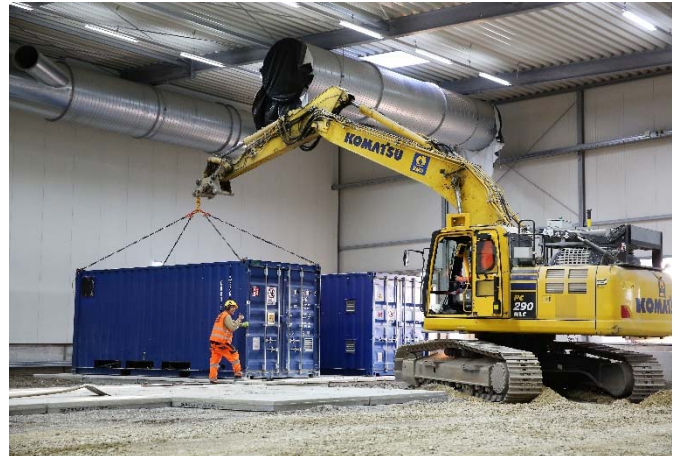
Auf den Betonplatten im Baufeld Nord wurden bereits die Kompressor-Einheiten der Abluftreinigungsanlage platziert