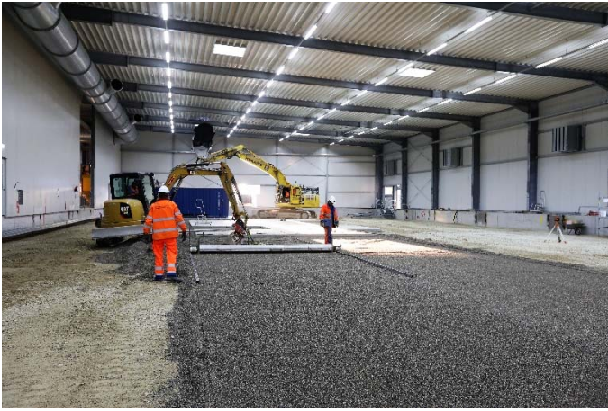
Das Baufeld Nord wird für die Installation der Abluftreinigungsanlage vorbereitet; Quelle: Pressefoto Roche